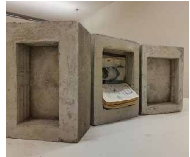
Narratives concrete, 2023/24 video mapping, 30 x 150 x 20cm

▶ Ayala Shoshana Guy (geb. 1992) aus Passau, Videoinstallationen und Monotypien: