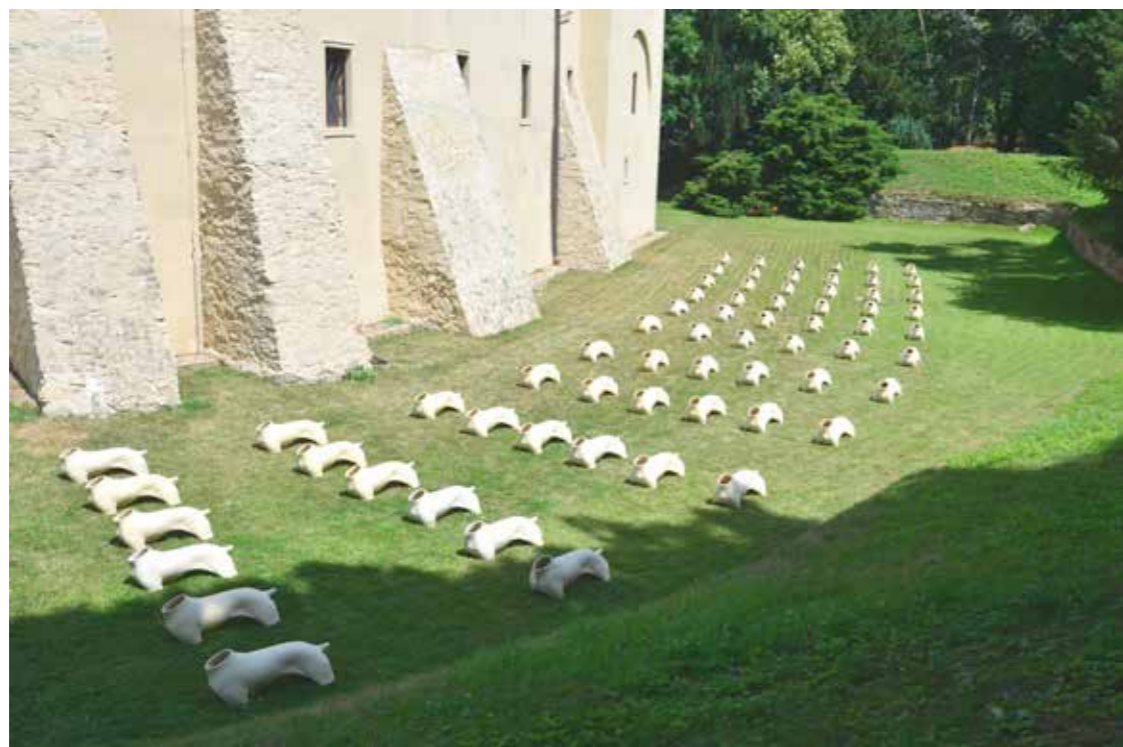
ARMÁDA - INSTALACE PRO STŘEDOČESKÉ MUZEUM V ROZTOKÁCH U PRAHY 2015, litá keramika, 36 x 10 m ARMÉE - INSTALLATION FÜR STŘEDOČESKÉ MUZEUM IN ROZTOKY BEI PRAG 2015, gegossene Keramik, 36 x 10 m