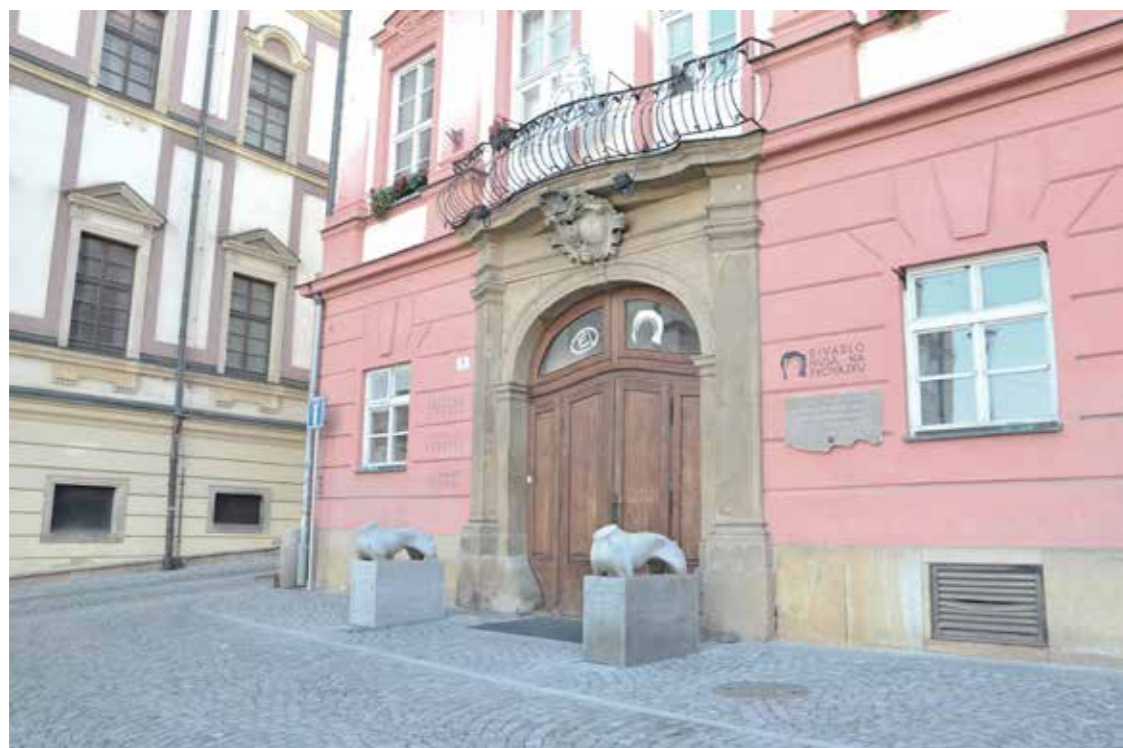
ARMÁDA - INSTALACE PRO DIVADLO HUSA NA PROVÁZKU, 2015 - 2016, beton ARMÉE - INSTALLATION FÜR THEATER HUSA NA PROVÁZKU, 2015 - 2016, Beton