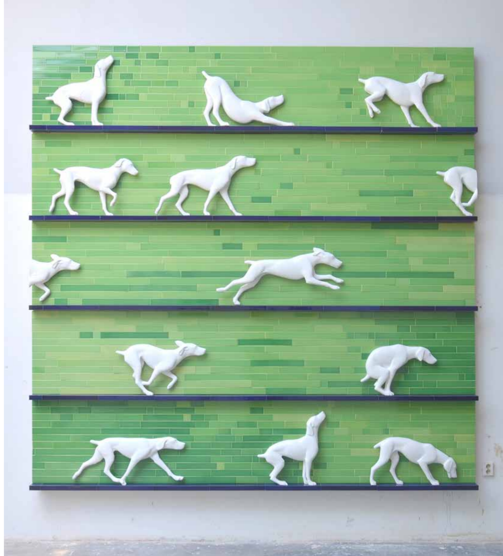
ZÁZNAM PROCHÁZKY, 2015, glazovaná litá keramika, 317 x 317 x 16 cm BERICHT ÜBER EINEN SPAZIERGANG, 2015, glasierte gegossene Keramik, 317 x 317 x 16 cm