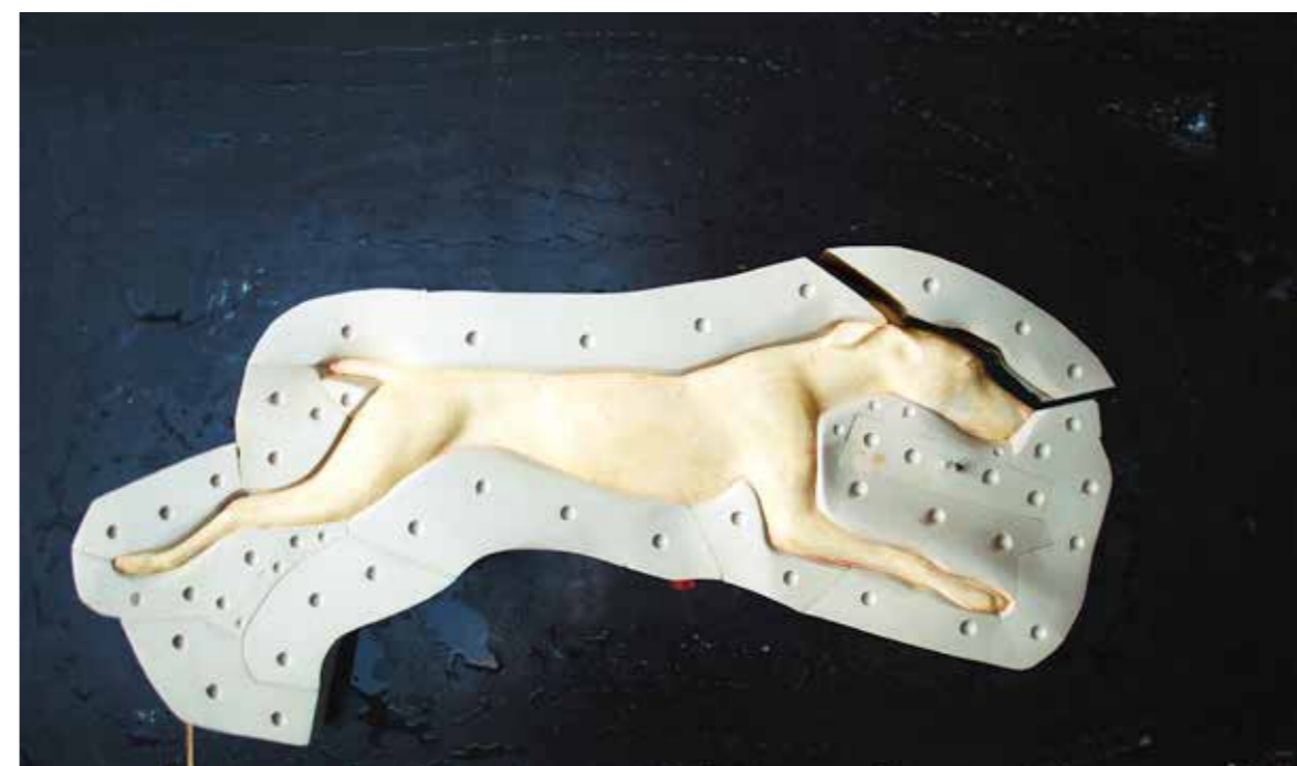
ZASTAVENÍ POHYBU II, 2015, kombinovaná technika, 84 x 148 x 20 cm GESTOPPTA BEWEGUNG II, 2015, Mischtechnik, 84 x 148 x 20 cm