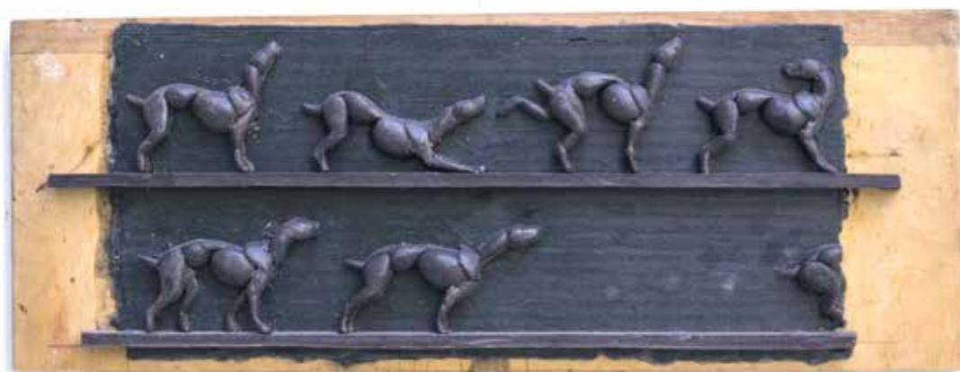
ZÁZNAM PROCHÁZKY – SKICI, 2015, vosk, 15 x 36 x 1,5 cm BERICHT ÜBER EINEN SPAZIERGANG - SKIZZEN, 2015, Wachs, 15 x 36 x 1,5 cm