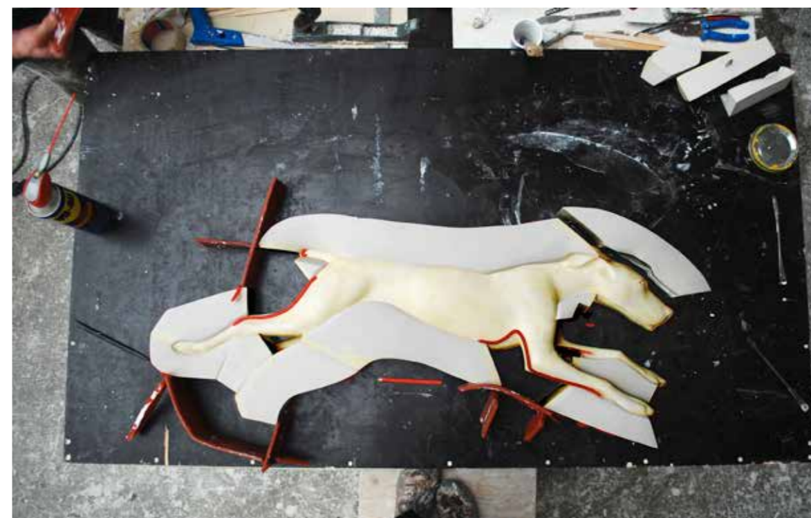
ZASTAVENÍ POHYBU I, 2015, kombinovaná technika, 84 x 148 x 20 cm GESTOPPTA BEWEGUNG I, 2015, Mischtechnik, 84 x 148 x 20 cm