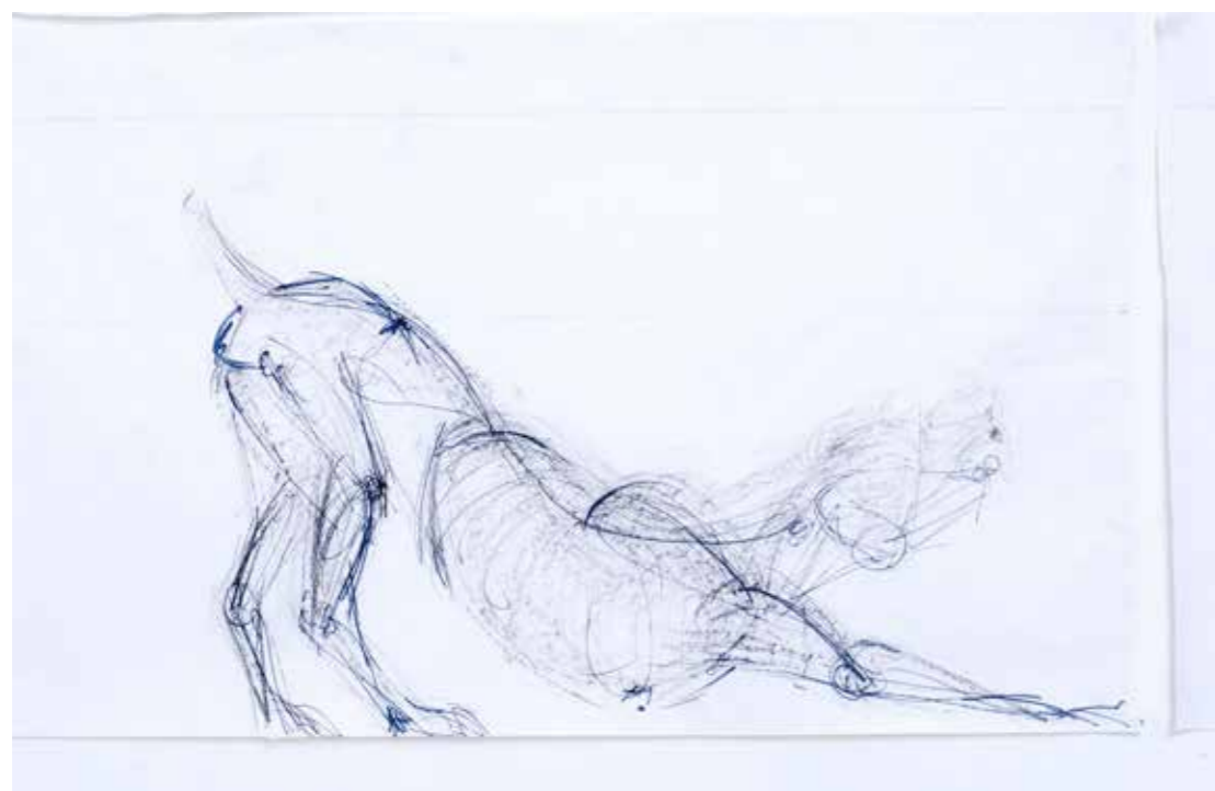
ZÁZNAM PROCHÁZKY – SKICI, 2015, 62 x 135 cm BERICHT ÜBER EINEN SPAZIERGANG - SKIZZEN, 2015, 62 x 135 cm