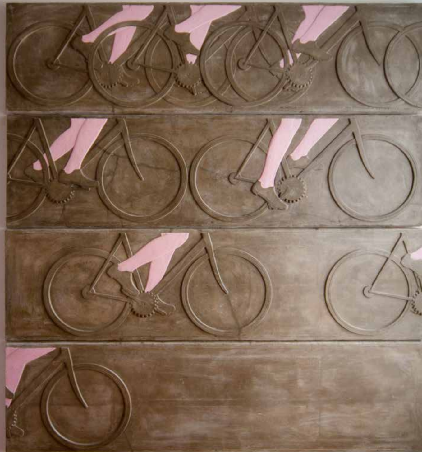
CYKLISTI , 2013, beton, akryl, 168 x 153 cm RADFAHRER, 2013, Beton, Acryl, 168 x 153 cm