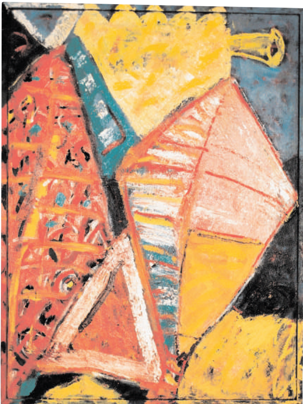
Asilisty 1998 Olej 62 x 82 cm