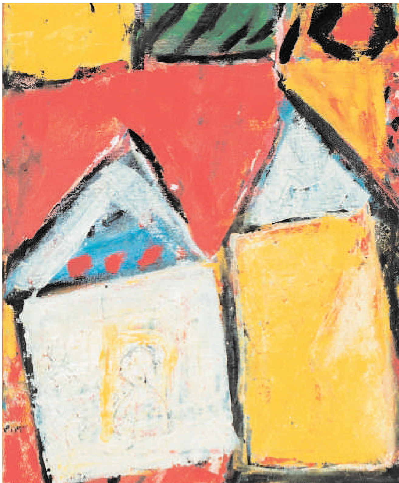
DOMY Die Häuser Öl auf Leinwand 45 cm x 55 cm