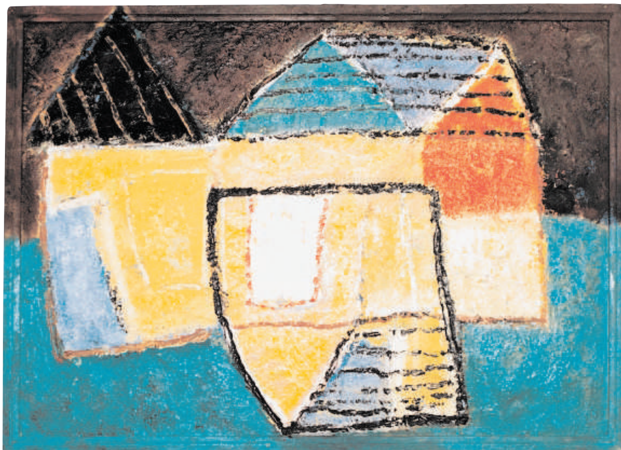
DOMY 1998 Olej 52 cm x 72 cm