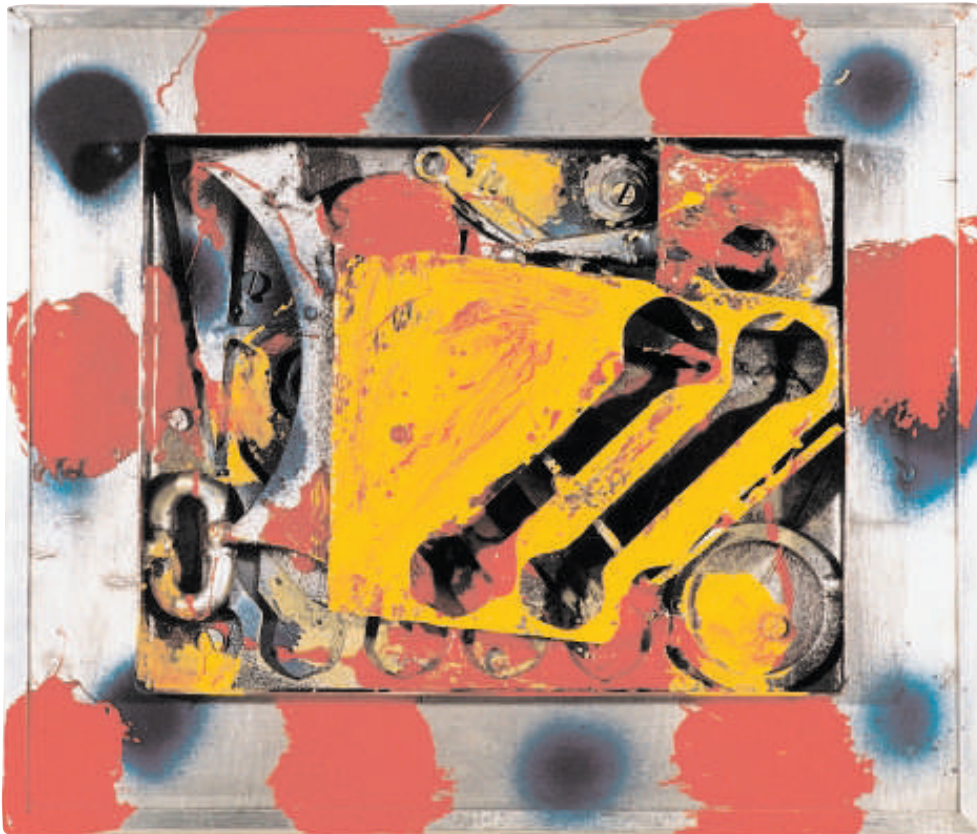
Metal, Email 35 cm x 29 cm