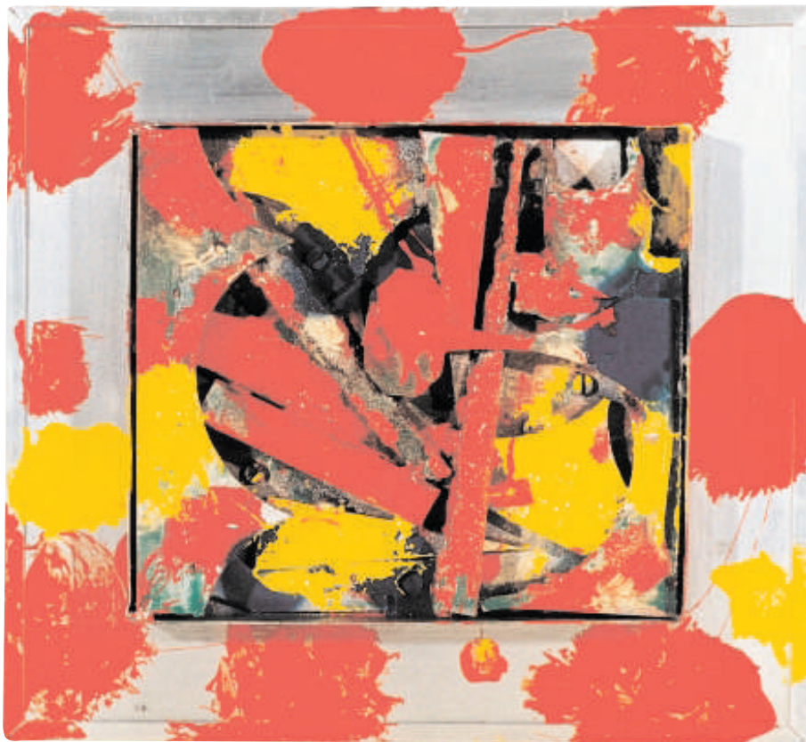
Metal, Email 29 cm x 29 cm