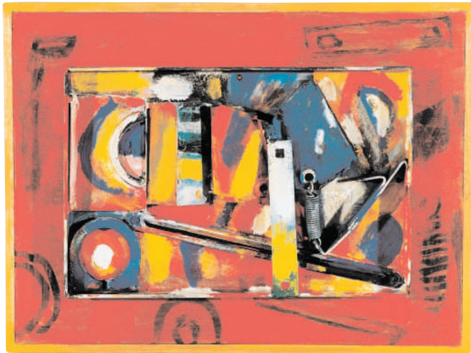
Metal, Holz Ölfarben 42 cm x 29 cm