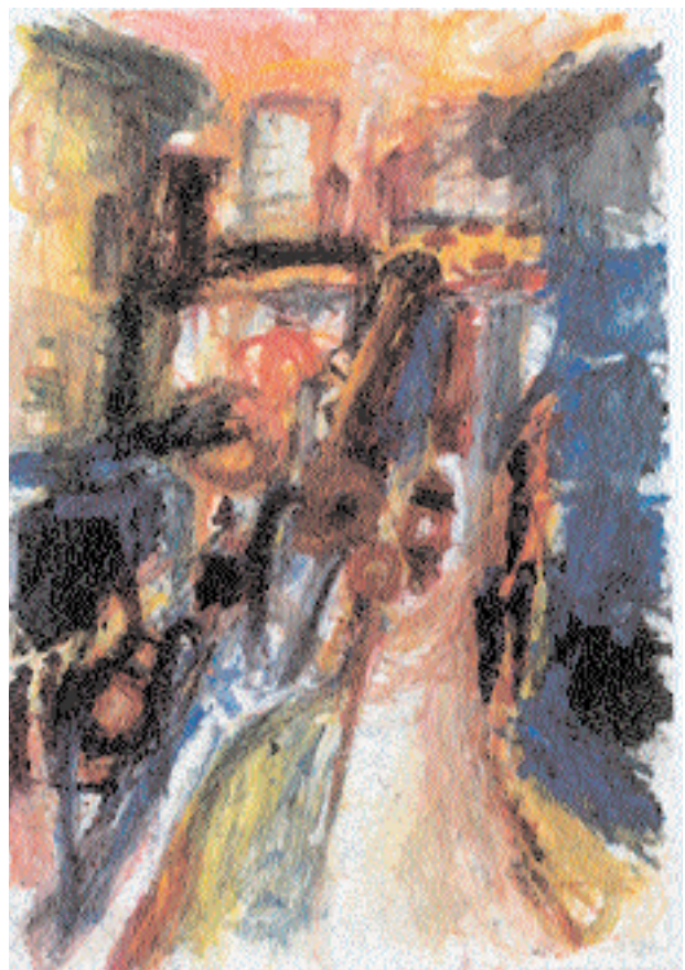
Aus der Serie „Stadtwelt“ 1998 Acryl auf Malkarton je 42 cm x 60 cm