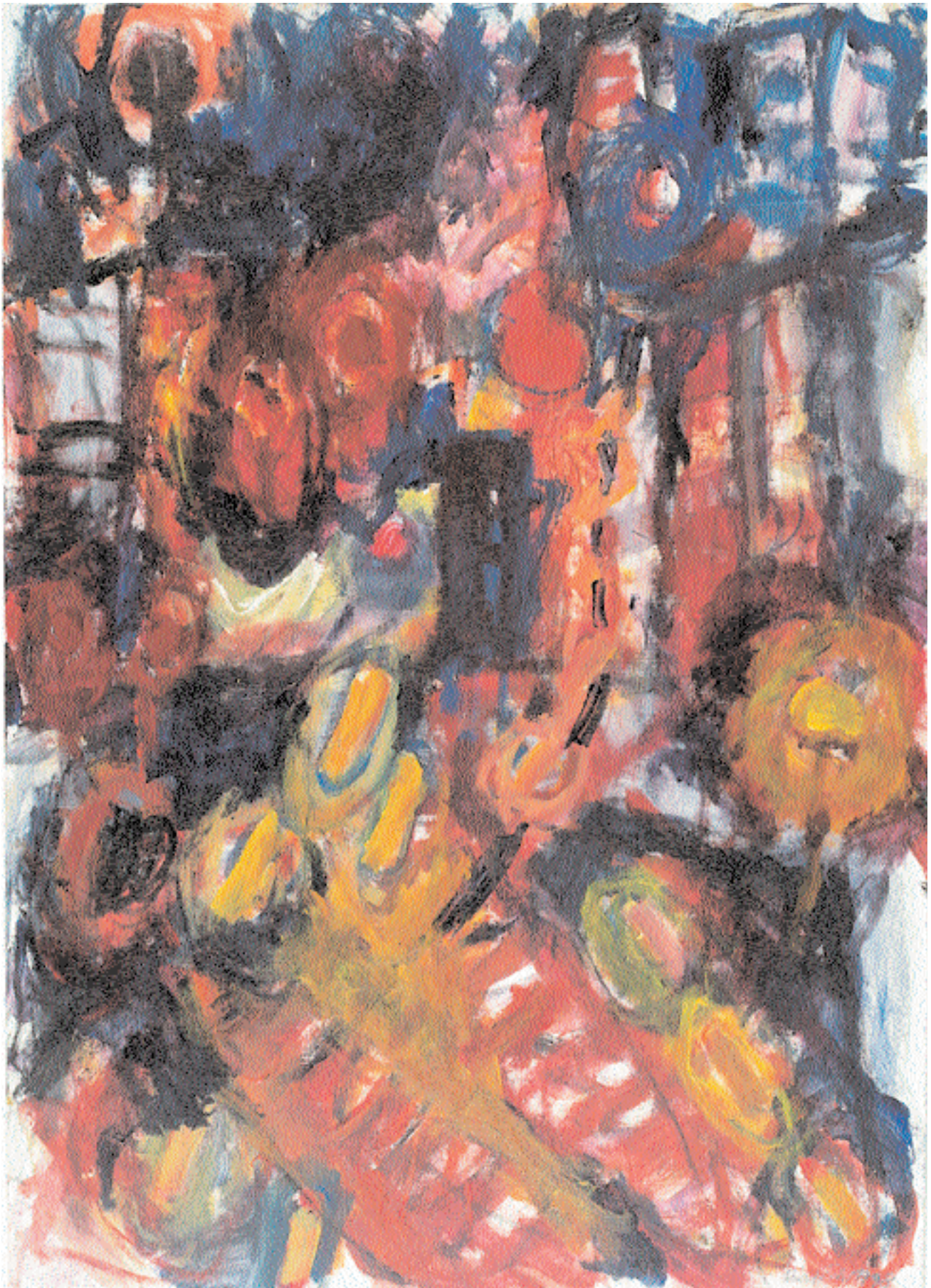
Aus der Serie „Stadtwelt“ 1998 Acryl auf Malkarton 50 cm x 70 cm