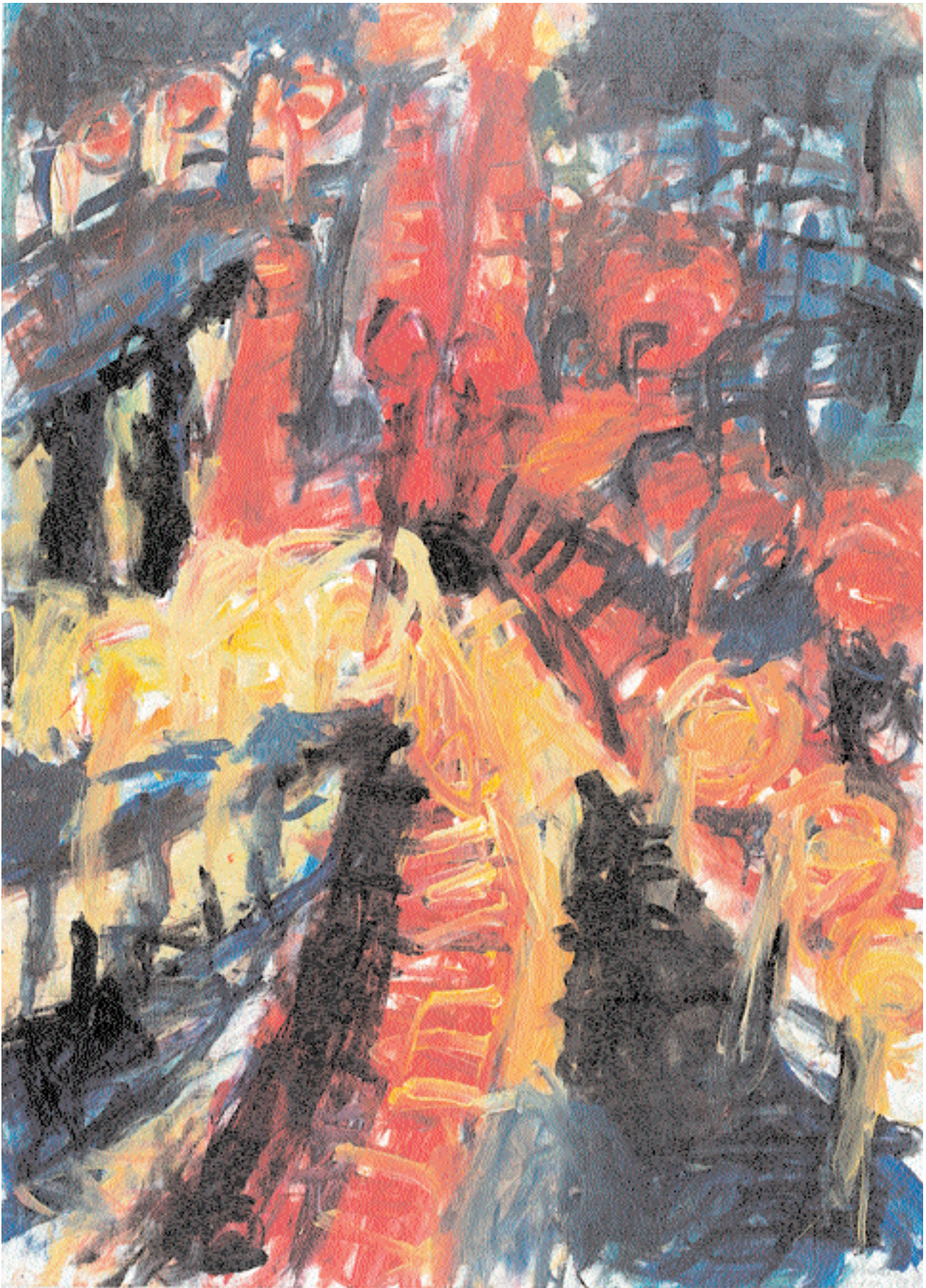
Aus der Serie „Stadtwelt“ 1998 Acryl auf Malkarton 50 cm x 70 cm