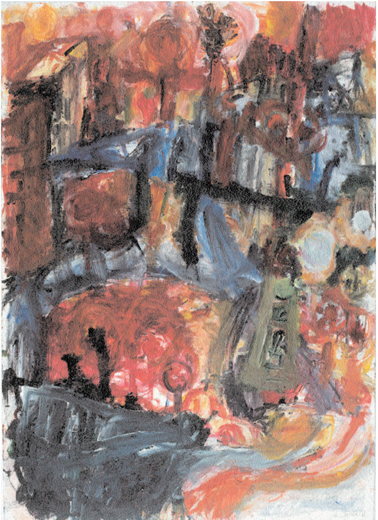
Aus der Serie „Stadtwelt“ 1998 Acryl auf Malkarton 50 cm x 70 cm