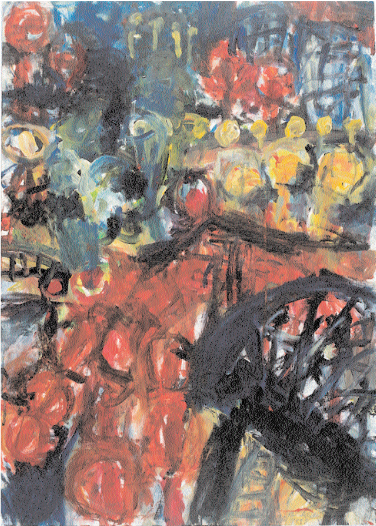
Aus der Serie „Stadtwelt“ 1998 Acryl auf Malkarton 50 cm x 70 cm