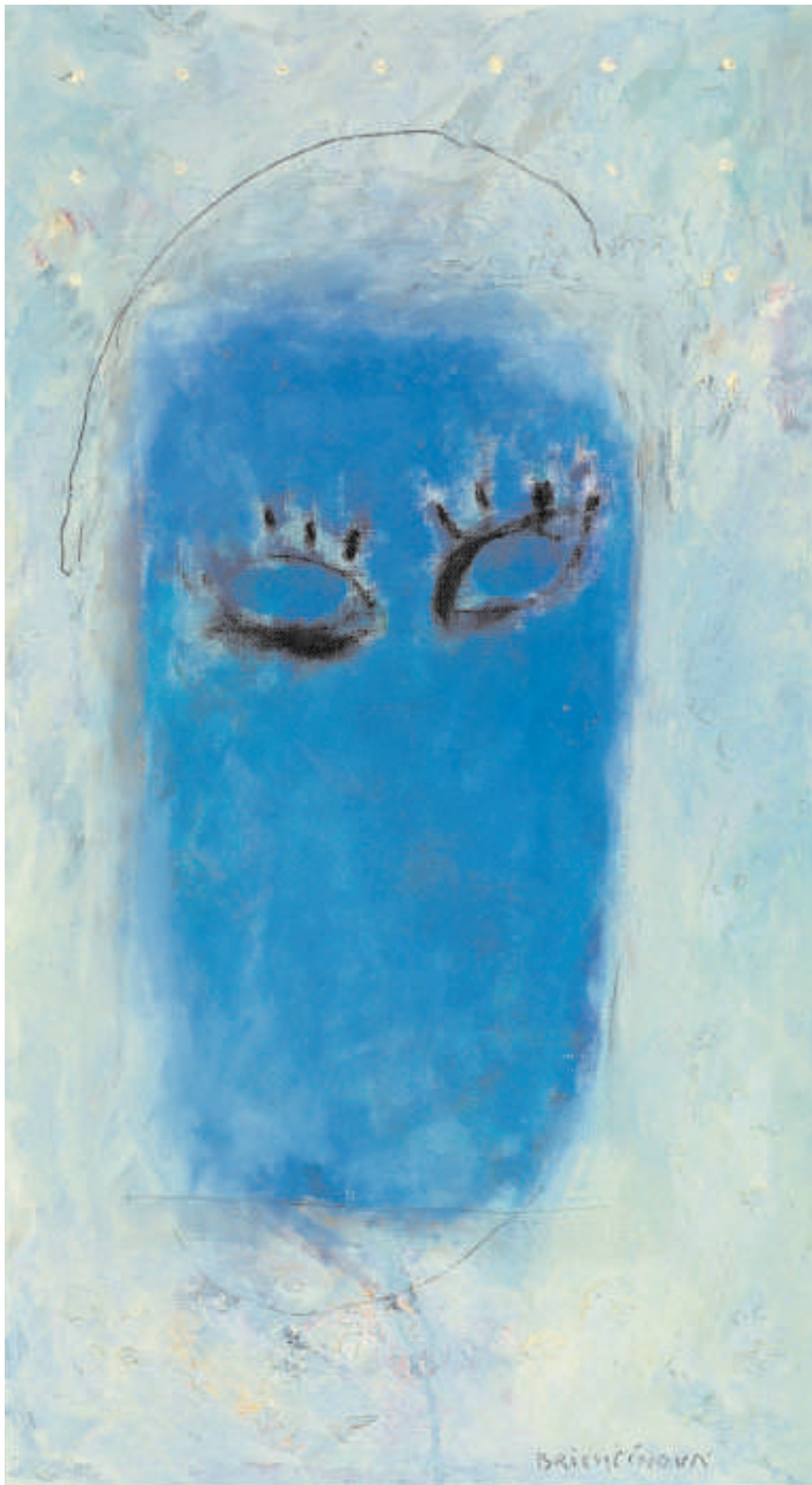
Milenec s modrými očima Der Geliebte mit blauen Augen 1996 Olej na sololitu Öl auf Hartfaser 36 cm x 63 cm