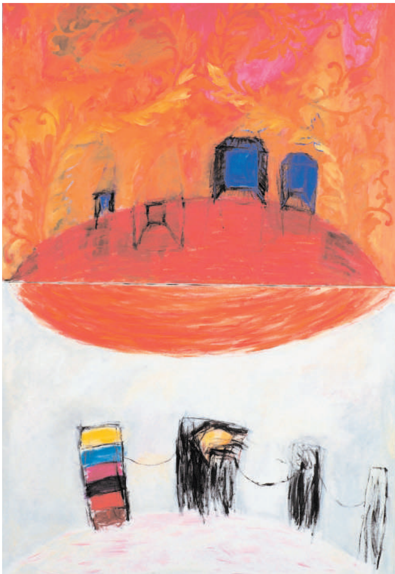
Třináctá komnata Das dreizehnte Gemach 1998 Olej na plátně Öl auf Leinwand 95 cm x 140 cm