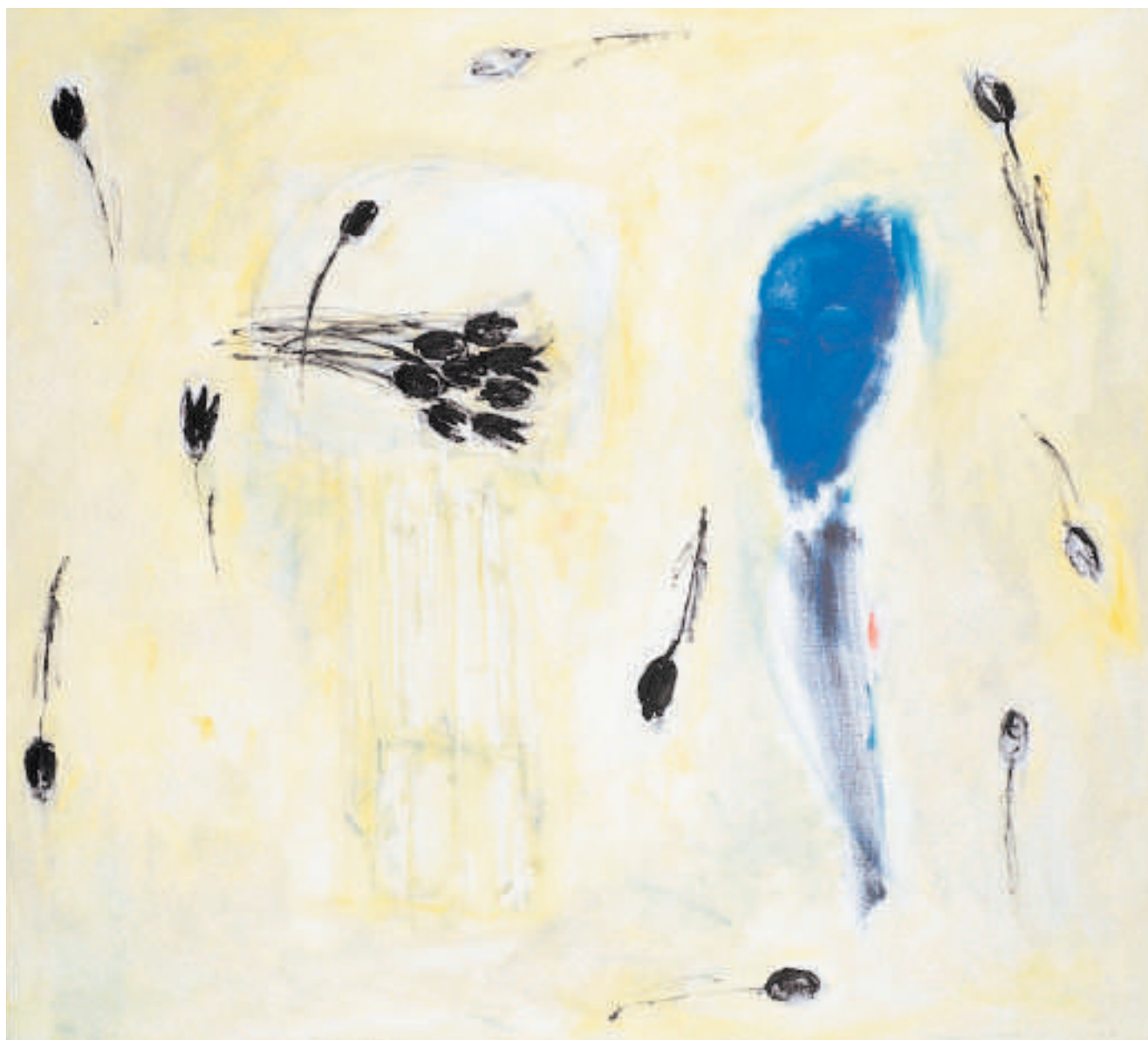
Sen Der Traum 1997 Olej na plátně Öl auf Leinwand 105 cm x 95 cm