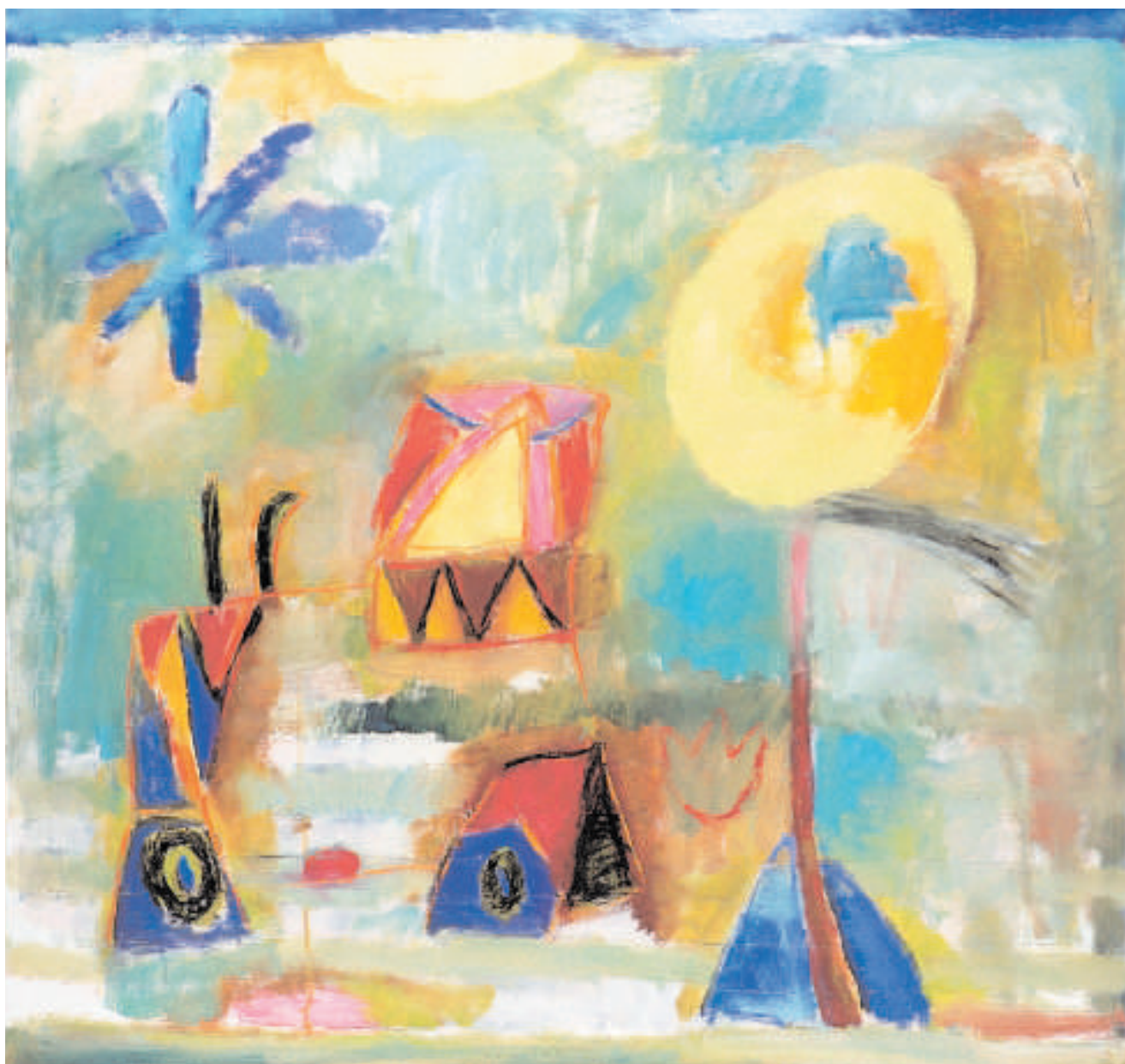
Krajina s bubínkem Landschaft mit der Trommel 1998 Olej na plátně Öl auf Leinwand 100 cm x 95 cm