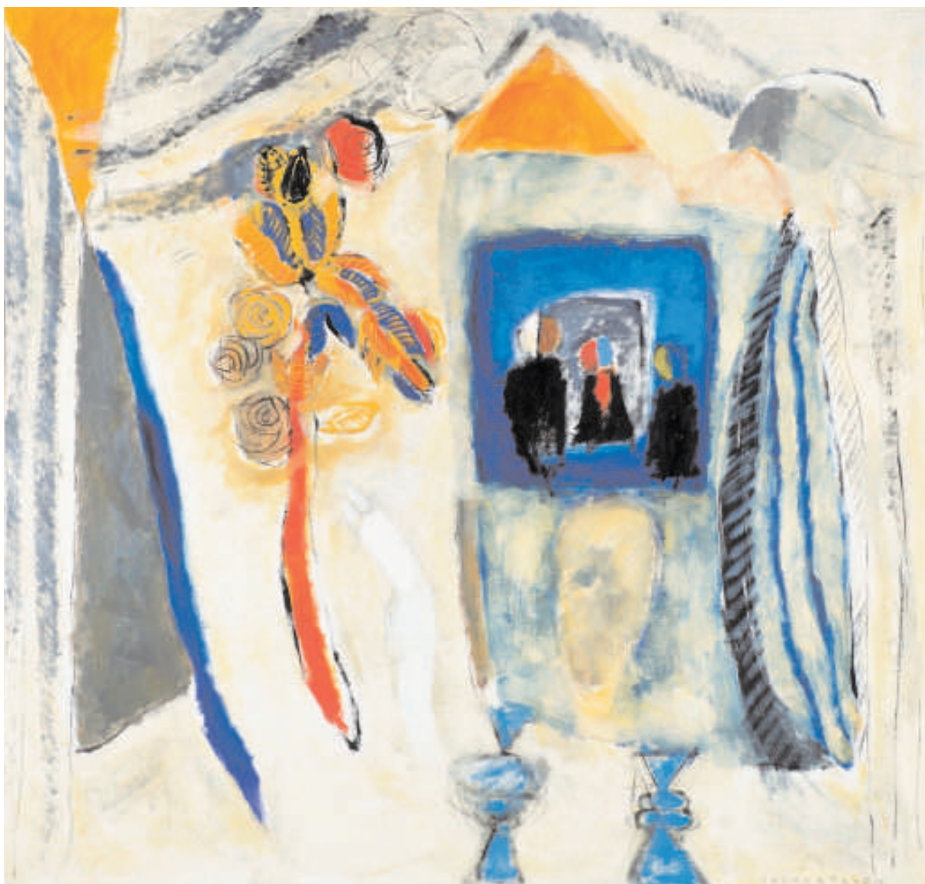
Divadlo Das Theater 1997 Olej na plátně Öl auf Leinwand 105 cm x 100 cm