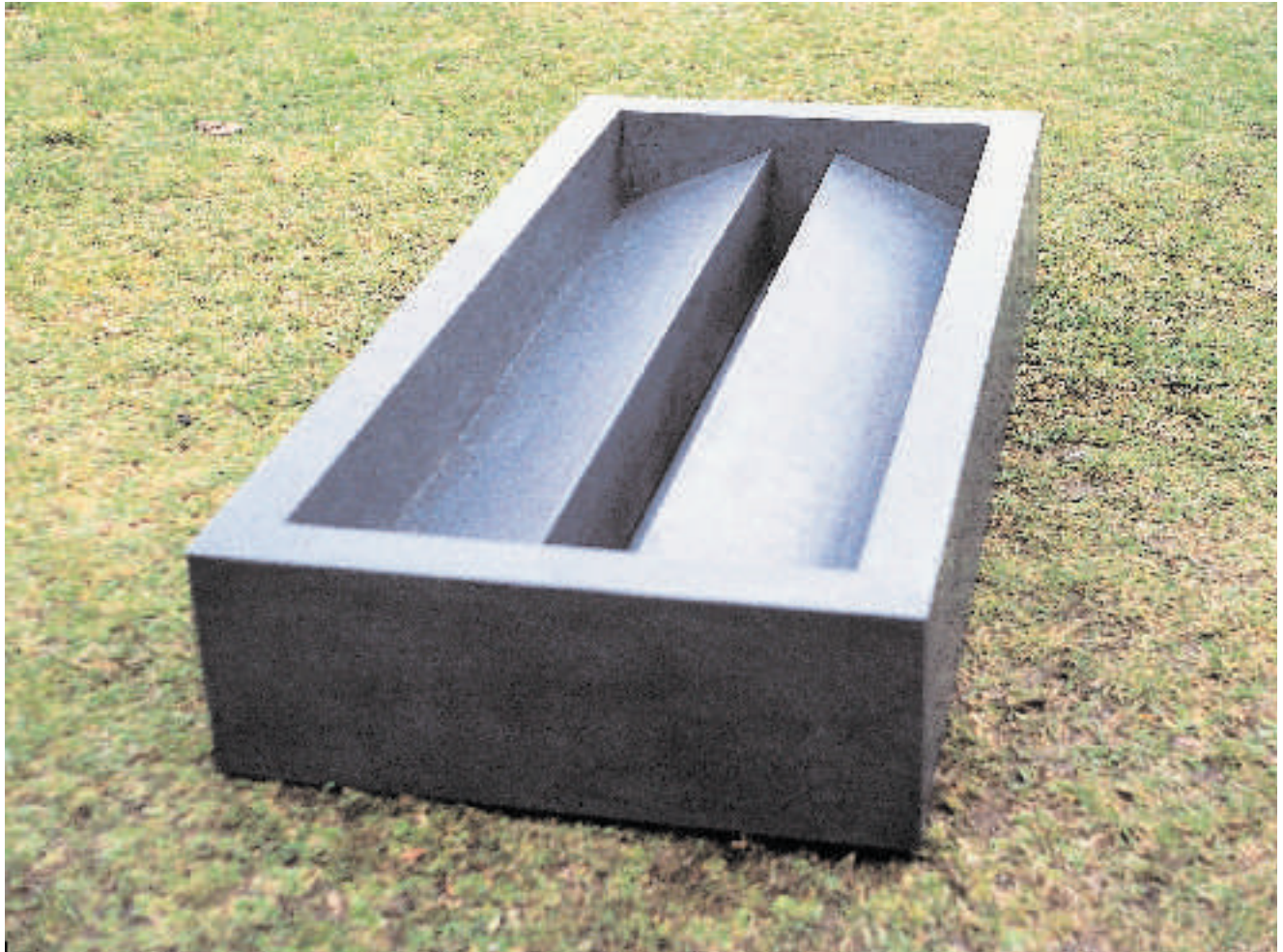
Untitled 1997 H. 25,5 x L. 150,5 x W. 70,5 cm Plywood Mixed Media