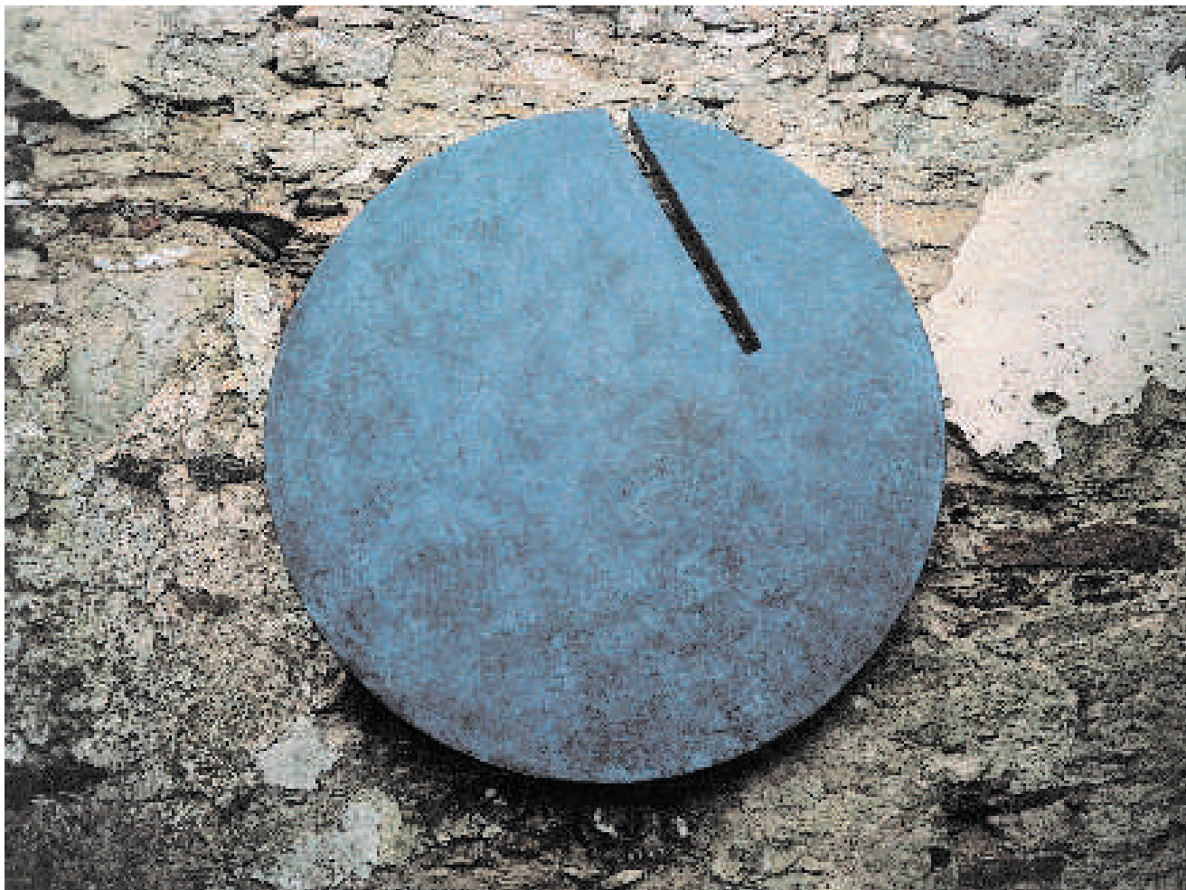
Wall Object 1996-97 ø 130 D. 9,5 cm Plywood Mixed Media