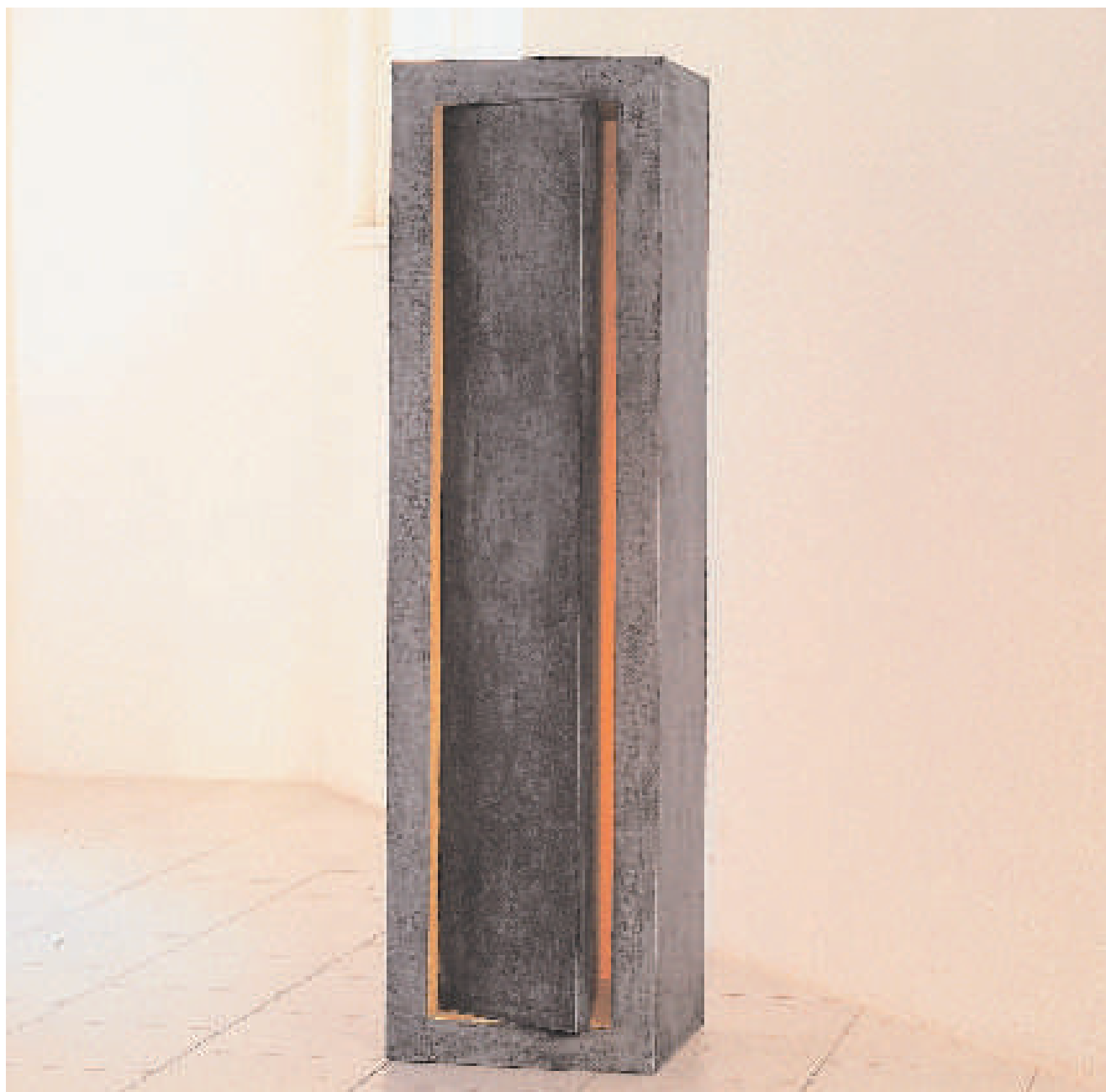
Untitled III 1997 H. 160 x W. 40 cm Plywood Mixed Media