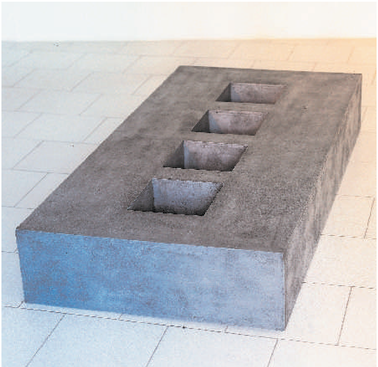
Untitled I 1996 H. 26 x L. 170 x W. 84 cm Plywood Mixed Media