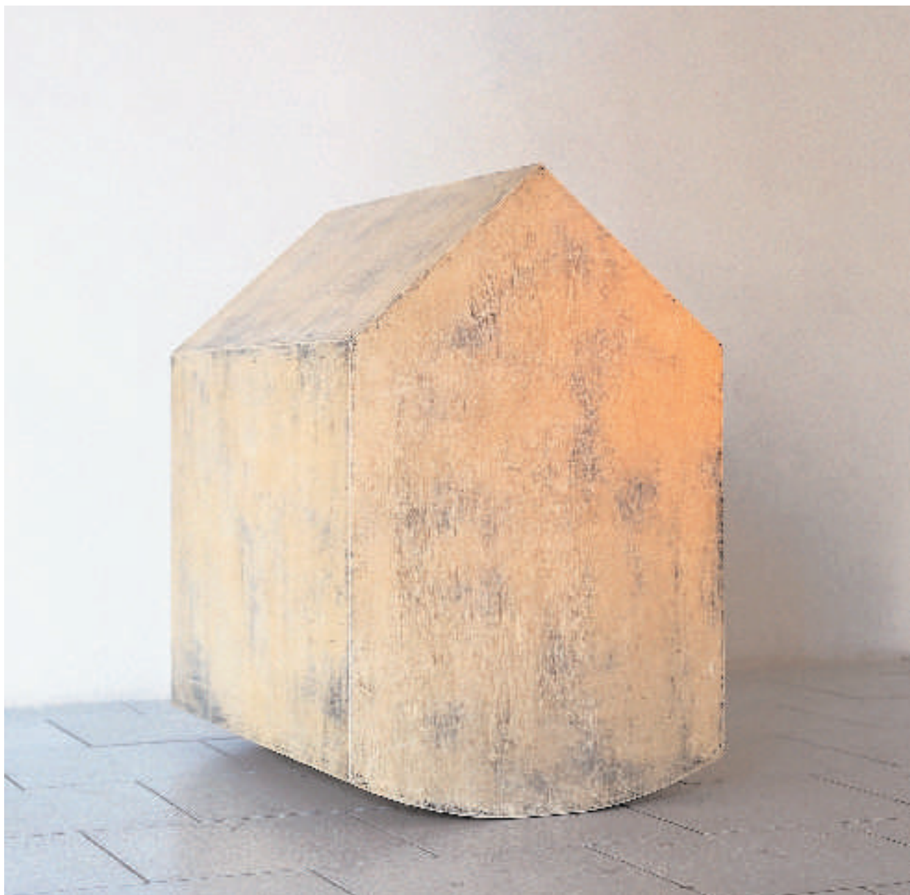
House 1996 81 x 79,5 cm Plywood Mixed Media