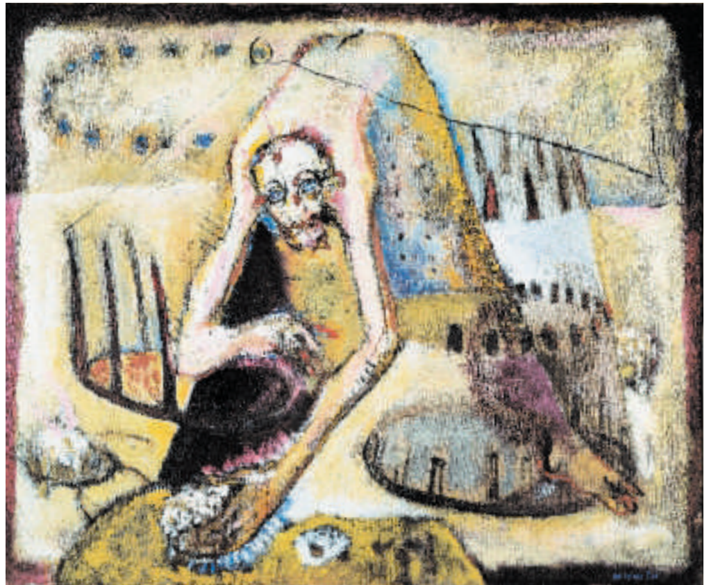
(Bild oben) Dobry pastyr / Guter Hirt 1995 Olej/Öl, Leinwand 110 x 130 cm