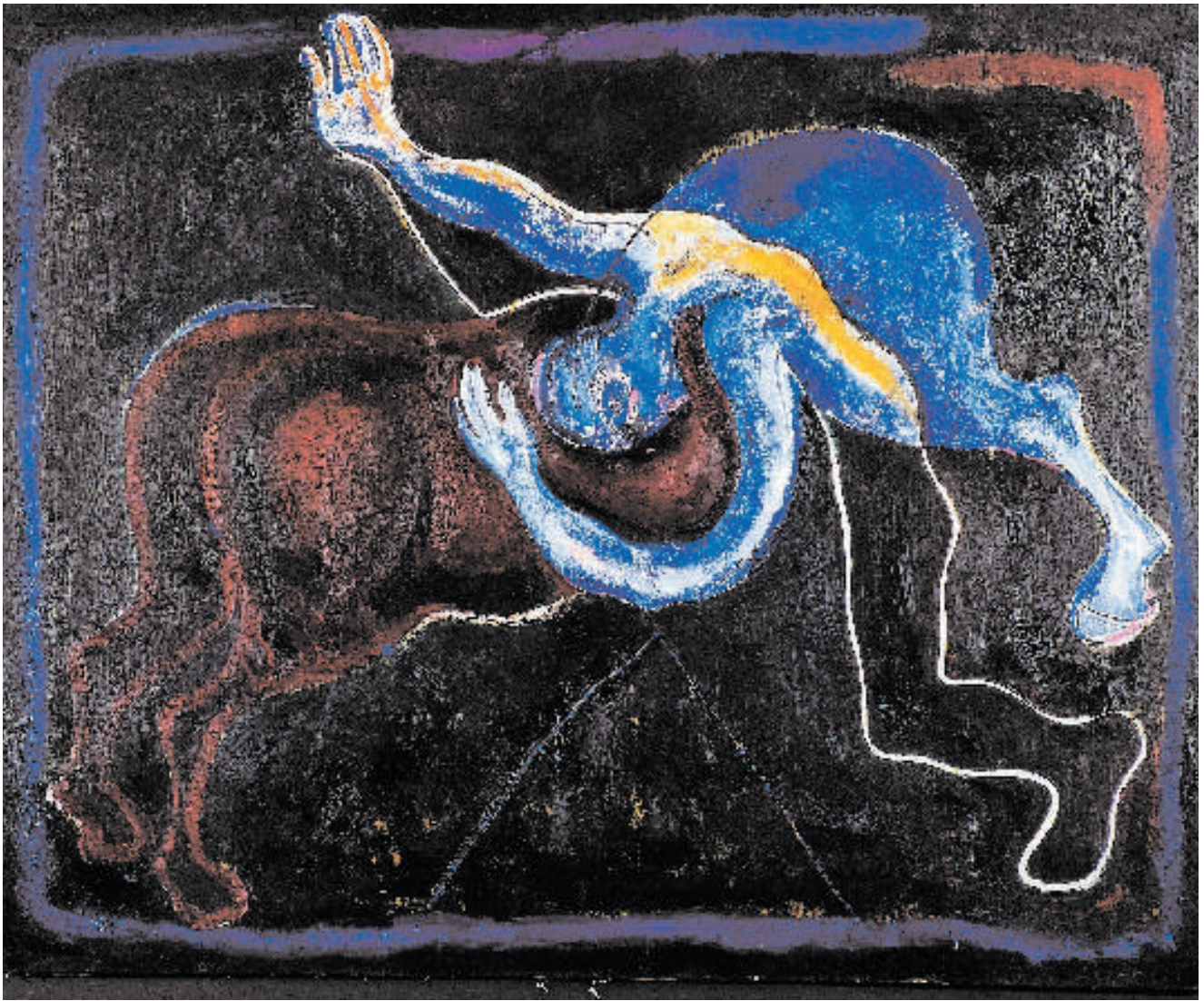
Zápas / Der Kampf 1995 Olej/Öl, Leinwand 162 x 130 cm