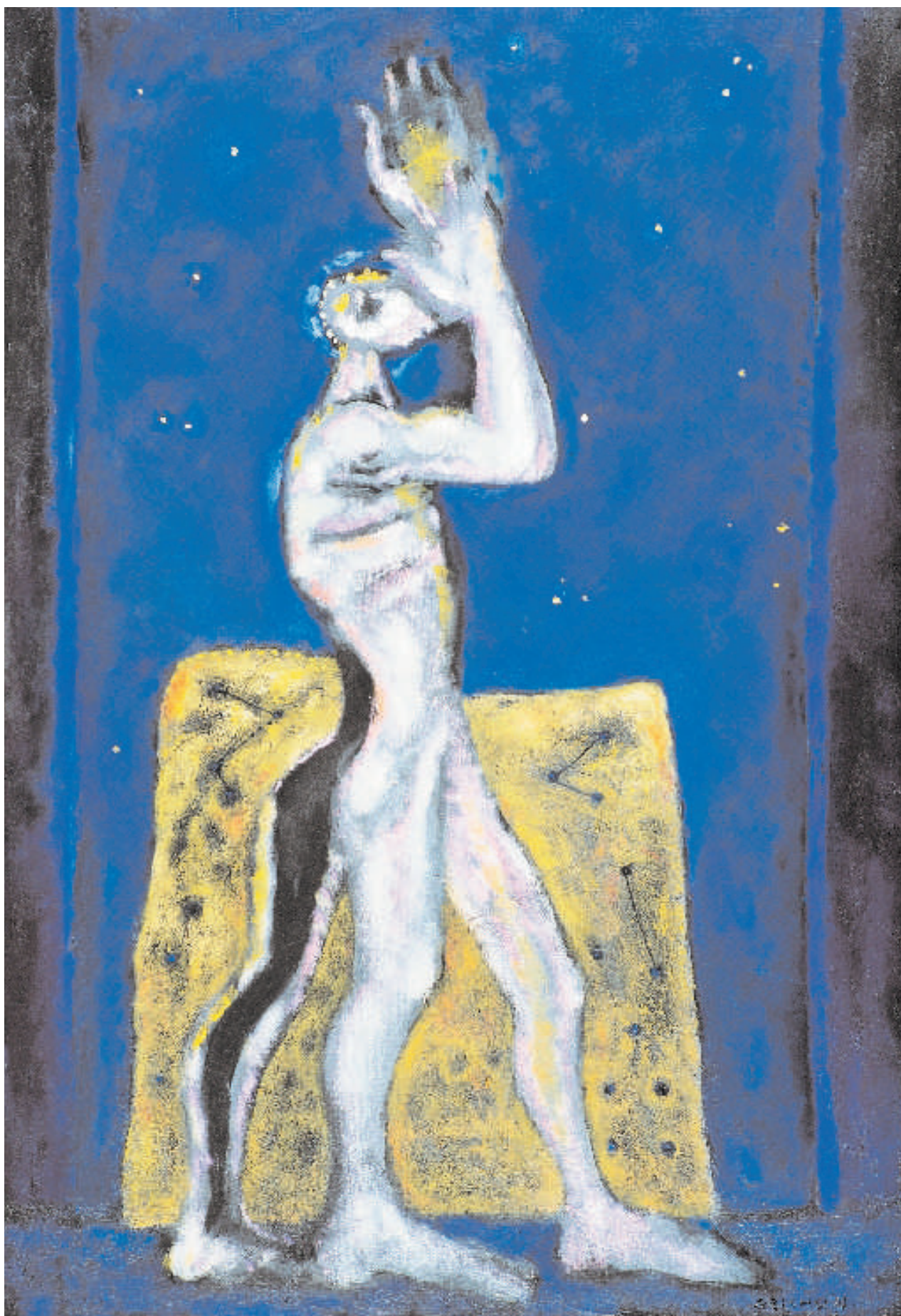
Hvězdná noc / Sternhelle Nacht 1995 Olej/Öl, Leinwand 130 x 90 cm