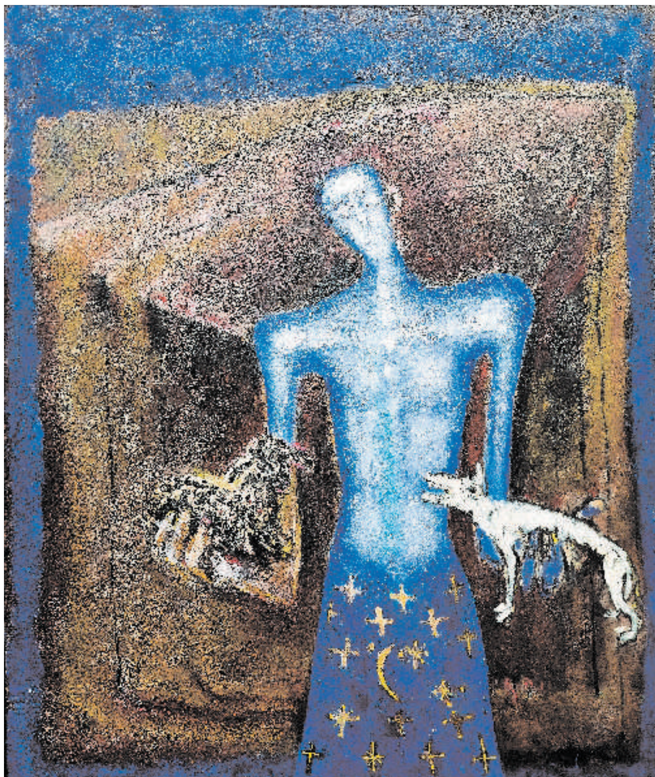
Muž s beránkem a vlkem I / Der Mann mit dem Lamm und mit dem Wolf I 1995 Olej/Öl, Leinwand 100 x 120 cm