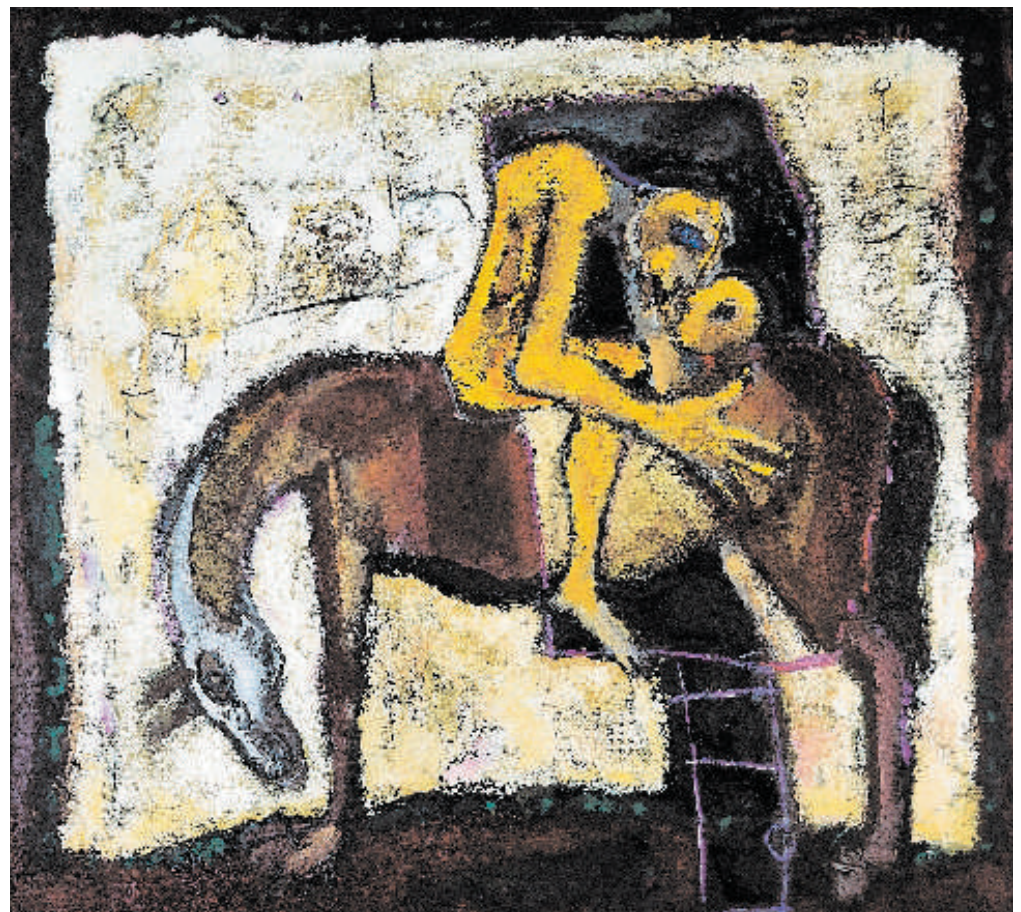
(Bild unten) Dar/sv. Martin III / Das Geschenk/Hl. Martin III 1995 Olej/Öl, Leinwand 120 x 130 cm