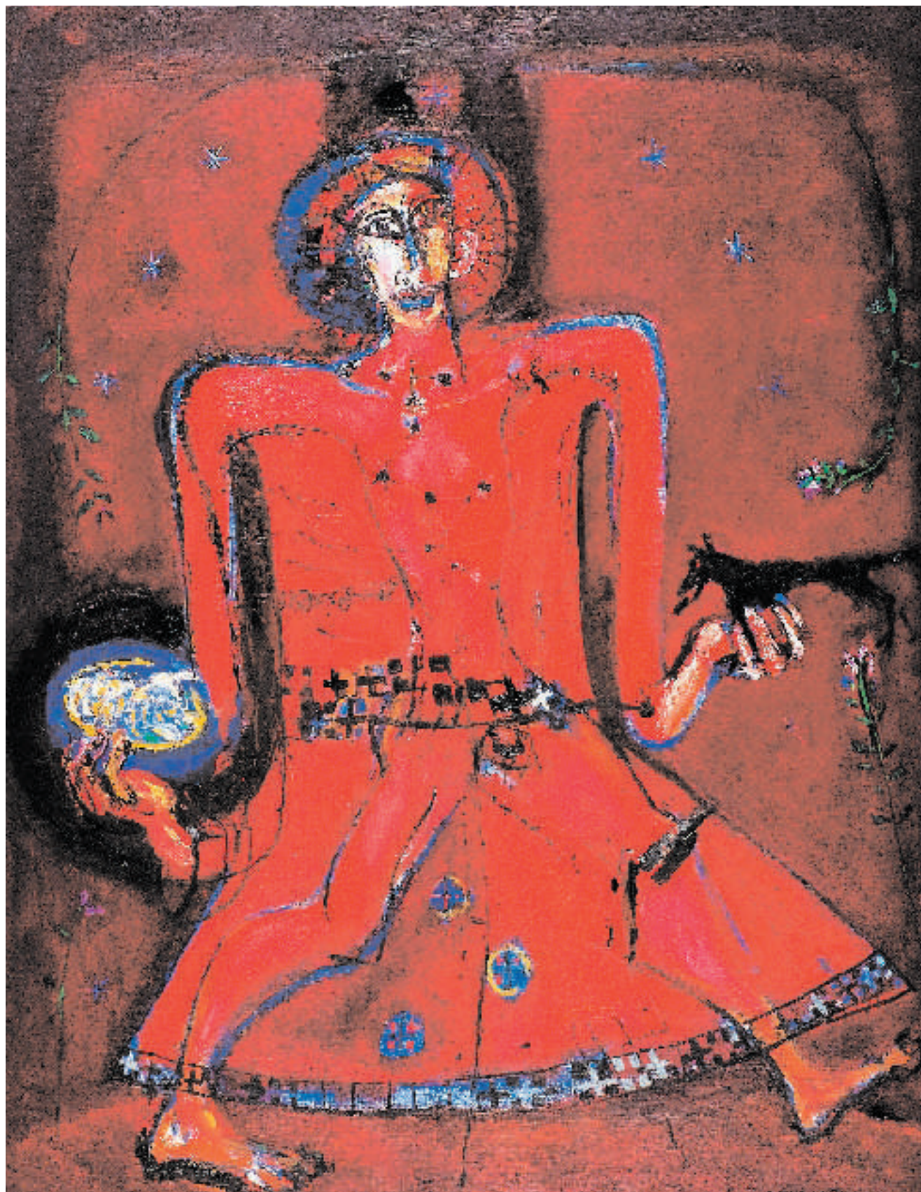
Muž s beránkem a vlkem II / Der Mann mit dem Lamm und mit dem Wolf II 1995 Olej/Öl, Leinwand 130 x 155 cm